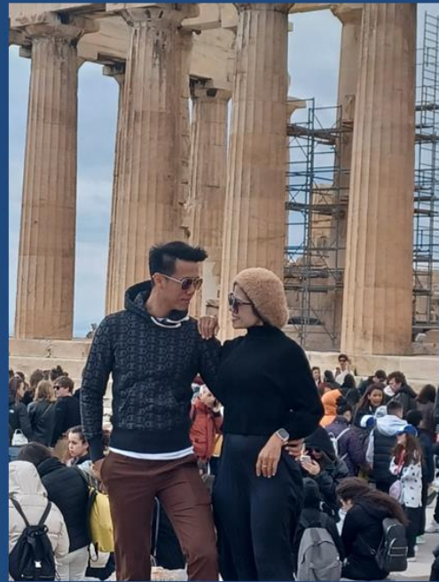
Ακρόπολη 2023